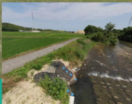
川と農業のつながり